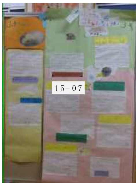
▲ふうちゃん新聞3号 (12月)