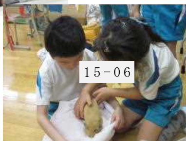
▲ふうちゃんの様子を見ながら ふうちゃんと遊んでいる。